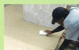
スポンジで仕上げる