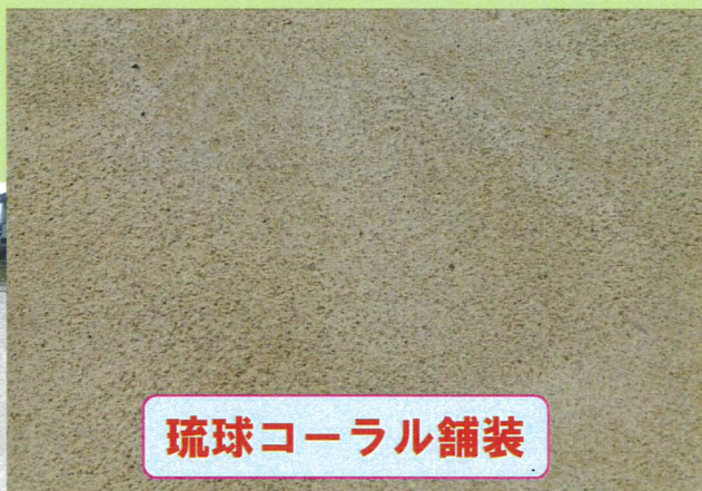
琉球コーラル舗装